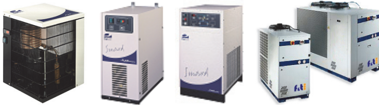
■ Smard SC ■ Smard ■ FTGD ■ HPKT