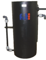
■ Vorschaltgeräte für Öl-Wasser-Trennsysteme