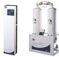
■ ED compact ■ ED ■ MWE ■ DB